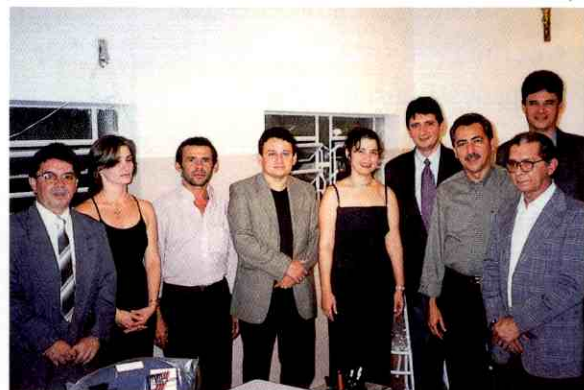
Diretores lojistas prestigiam posse da diretoria da CDL de Valença

inauguração da CDL de Valença é um passo importante na trajetória de expandir por importantes cidades do interior a atividade classista organizada.