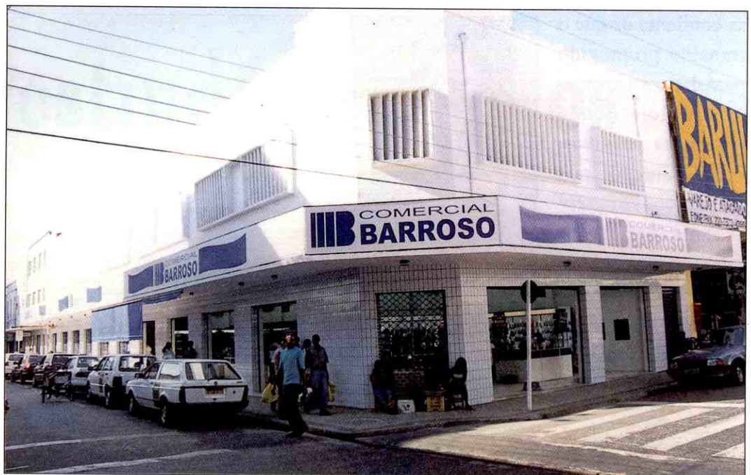
Nova loja do Comercial Barroso: climatizada