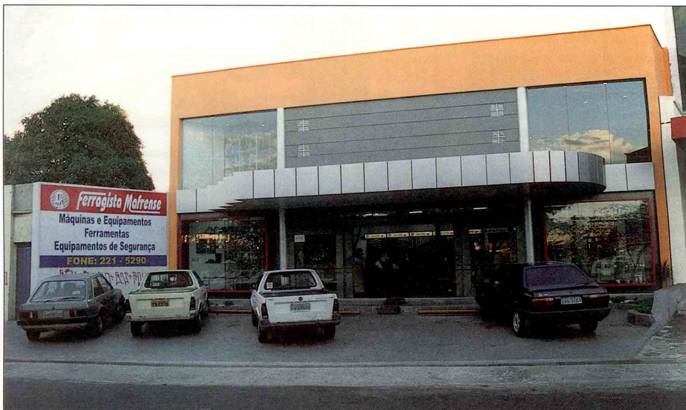
Ferragista Mafrense: mudança para atender melhor aos clientes

O lojista é um empreendedor por natureza. Seja em tempos de abundância seja em tempos de maior escassez, não importa como segue a maré, sempre há de se ver um novo estabelecimento sendo criado, uma loja sendo ampliada, enfim, vê-se negócios acontecendo e abrindo novas possibilidades para promover o desenvolvimento econômico e social. É o desafio pessoal de empresários, que acreditam na ação para criar