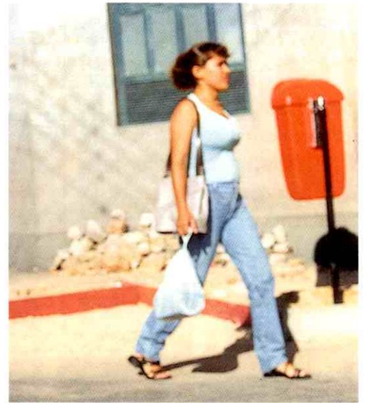
Calçadas: novo visual

A obra, já iniciada, deve custar R$ 350 mil e apresentará uma padronização na fachada das lojas sendo parte da cobertura feita em policarbonato, material transparente como o acrílico. Neste trecho, serão instalados dois boxes para informações turísticas.